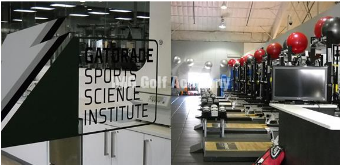
メンタルコンディショニング Mental Conditioning

選手キャリアは短い。競争は激しい。 IMG パフォーマンス部門は質の高いサービスとプロフェッショナルな対応で、夢に向かってトレーニングするアスリートたちを支えます。