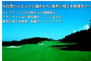
大自然のふところに抱かれた、後世に残る本格派名コース ゴルフプレイにだけ味をえる醍醐味と、 クオリティの高い満足感が、ここにはある。 後世に残る本格派、鈴鹿カンツリークラブ。