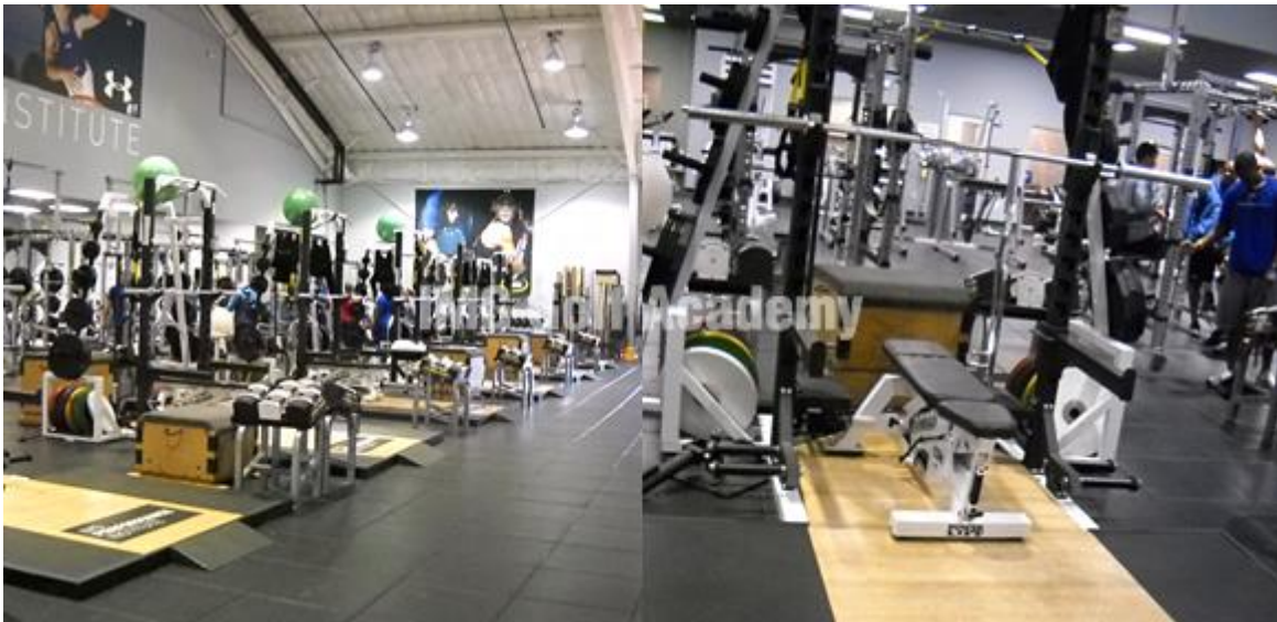
ビジョントレーニング Vision Training

アスリートの体は高性能の車のようなもの。驚くような力、パフォーマンスが実現可能。しかしそれには、最高品質の燃料が必要です。求めるパフォーマンス力を実現するために自分の栄養を最適化することが重要です。