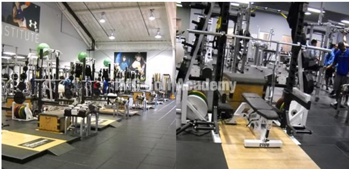
ビジョントレーニング Vision Training

アスリートの体は高性能の車のようなもの。驚くような力、パフォーマンスが実現可能。しかしそれには、最高品質の燃料が必要です。求めるパフォーマンス力を実現するために自分の栄養を最適化することが重要です。