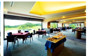
大阪市内から僅か60分の都市型リゾートコースへ。