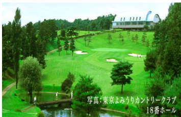
写真: 東京よみうりカントリークラブ 18番ホール