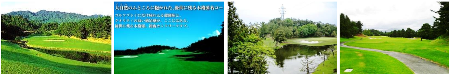
大自然のふところに抱かれた、後世に残る本格派名コース ゴルフプレイにだけ味をえる醍醐味と、 クオリティの高い満足感が、ここにはある。 後世に残る本格派。鈴鹿カンツリークラブ。