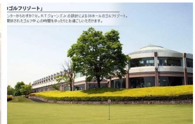
「ゴルフリゾート」 シニアから若者まで、R.T.ウォンズによる36ホールのゴルフリゾート。 競技されたゴルフ中心の時間をゆったりとお過ごしいただけます。